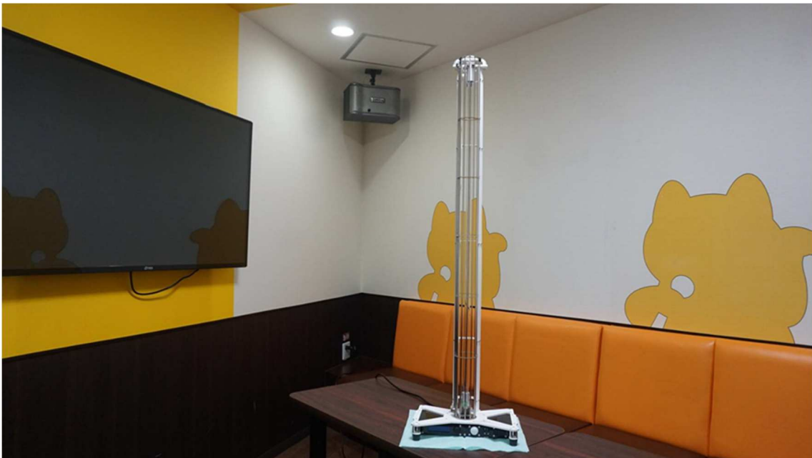
(写真2) カラオケルームで消灯中の除菌・ウイルス不活化機器の様子