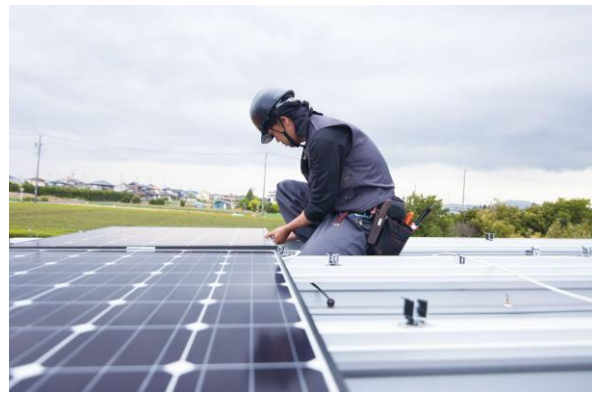
▲カクイチが保有するコンテナ／ガレージ屋上の小規模太陽光